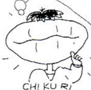
CHI KU RI